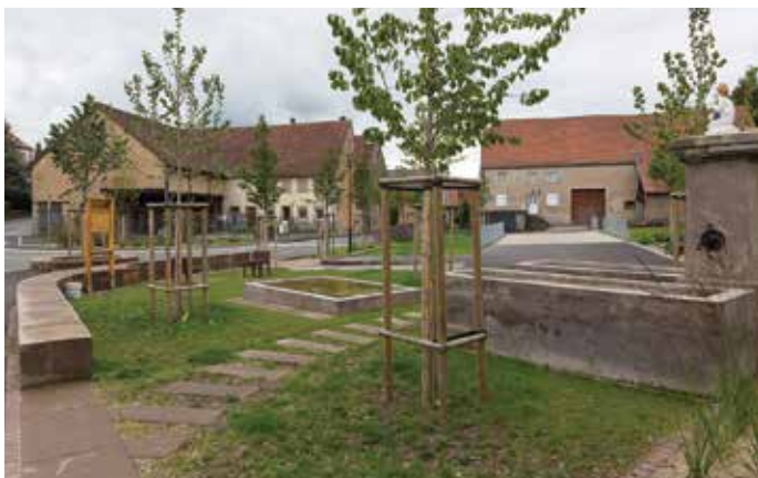
▲ Vue depuis la rue de Bining

Le site s'inscrit au cœur du village sur un terrain légèrement pentu accueillant au nord-est une fontaine. En périphérie d'un îlot bâti, ce petit espace est encadré par quatre voies de circulation dont la RD n°35 (rue de Bining), traversante principale de Rahling. La banque et l'arrêt de bus fonctionnent en harmonie avec la place, amenant de l'animation.