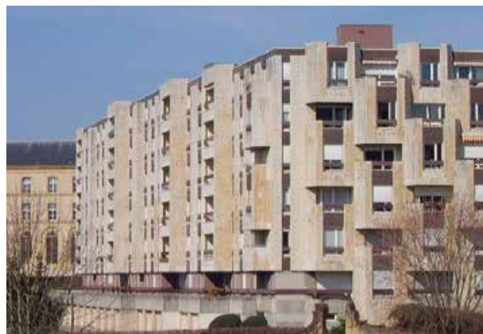
▲ Les opérations présentées dans le cadre de ce site internet permettront notamment de rendre compte de l'évolution du logement et des formes urbaines au cours du XX e siècle avec, avec par exemple, le quartier du Pontiffroy à Metz

Habiter ou réhabiliter demande d'appréhender, de connaître le territoire existant pour pouvoir s'y intégrer de manière harmonieuse. Parce que la manière d'habiter un territoire découle de ses spécificités, de son histoire, de sa géographie et de son ancrage culturel, le CAUE propose de mener en 2016 des actions de sensibilisation du