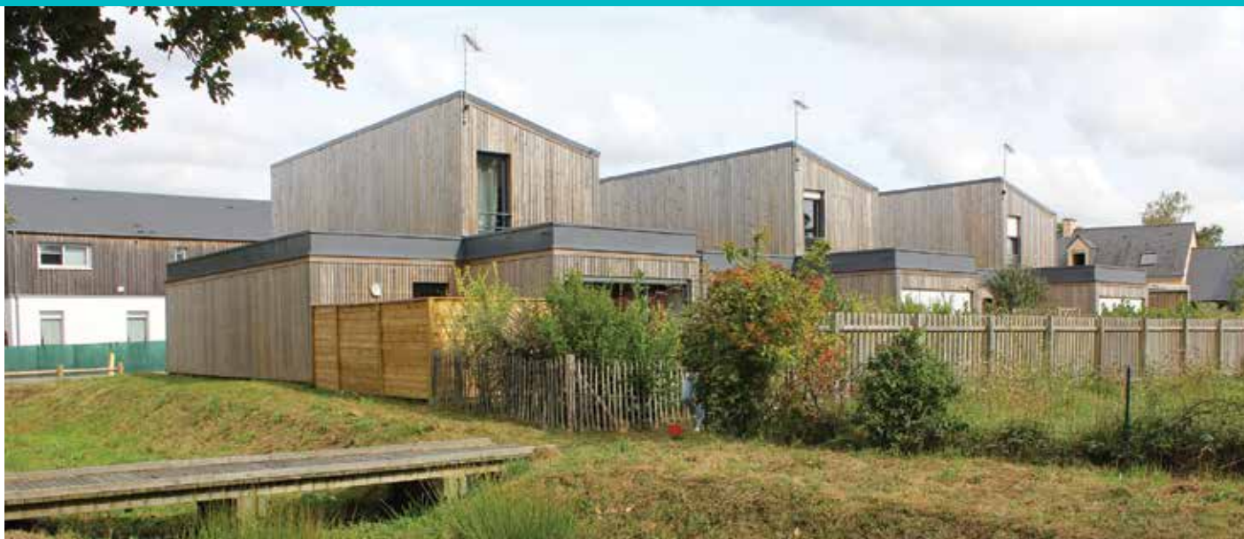
▲ Chapelle-des-Marais, Le Clos du Moulin (44), ARLAB architectes - Ensemble de 13 éco-maisons

«Nul n'est besoin de faire de la terre un paradis : elle en est un. À nous de nous adapter pour l'habiter» Henry Miller