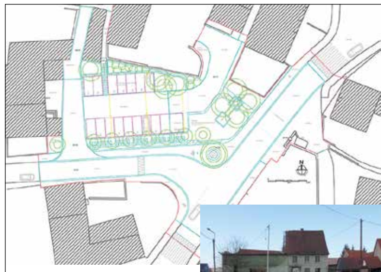
▼ Plan masse

Dans le cadre de la démolition d'une ancienne ferme, la municipalité a mené une réflexion sur le réaménagement et l'extension de la place de la Fontaine. Consciente des enjeux qualitatifs du projet situé au cœur de la commune, elle sollicite l'avis du Conseil d'Architecture d'Urbanisme et de l'Environnement de la Moselle. Cette réalisation montre combien l'aménagement d'un petit espace public participe fortement à l'amélioration de la qualité du cadre de vie de tout un centre bourg, créant ici un havre de paix d'une grande sensibilité.