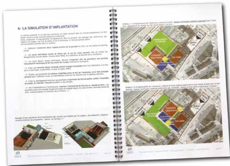
▲ Pré-programme architectural pour l'extension d'un centre d'animation culturelle : exemple de schéma d'implantation

Au-delà du pré-programme, si la collectivité le souhaite, un conseil peut être apporté lors de la sélection du maître d'œuvre,