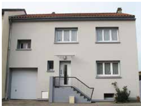
▲ Photos présentant une maisons avant/après travaux de ravalement, inclant la pose d'une isolation thermique. Dans le cadre de ce projet réalisés sur la base d'un conseil du CAUE, les caractéristiques architecturales de cette maison de la période de la Reconstruction ont été préservées.